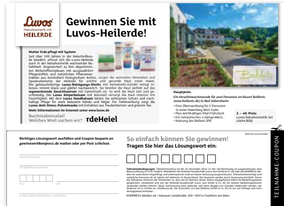
Beispiel, Originalabbildung in DIN A5

Dazu zählt natürlich auch die Erfassung der Gewinnspielseinsendungen. Gerne erstellen wir Ihnen ein individuelles Angebot. Sprechen Sie uns an: andreas.bauer@konpress.de