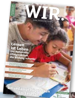
Exklusivausgabe für Renovabis