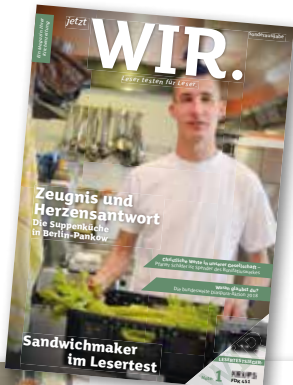
Exklusivausgabe für Bonifatiuswerk